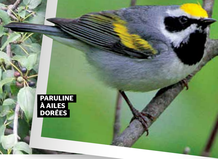
PARULINE À AILES DORÉES