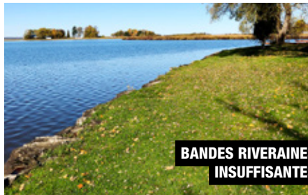
BANDES RIVERAINES INSUFFISANTES

■ La présence de bandes riveraines insuffisantes , l'érosion des sols, les pesticides et les contaminants provenant des industries sont tous des éléments qui détériorent la qualité de l'eau. Cela a des conséquences non négligeables sur la faune aquatique de la rive sud du lac Saint-Louis