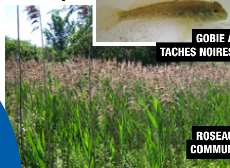
GOBIE À TACHES NOIRES

■ La propagation des espèces exotiques envahissantes est également une autre menace présente au sein des écosystèmes du lac Saint-Louis. En effet, la présence de ces espèces exotiques affecte nos espèces indigènes en exerçant une compétition directe pour l'espace, l'habitat, la nourriture ou encore altère l'habitat d'origine.