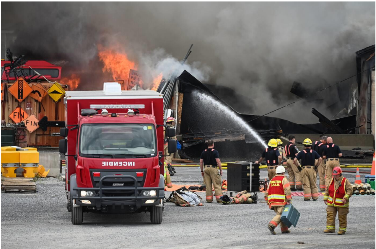
Figure 2 Incendie d'une usine d'asphalte à Saint-Hubert, QC.

Plus près de nous, à Saint Hubert, une usine de bitume fut la proie des flammes le 18 juillet 2022 (Figure 2).